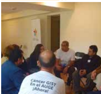
Pacientes y familiares participando en Taller de acompañamiento psicológico