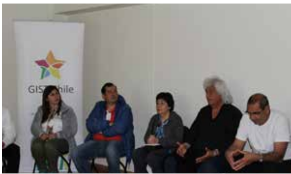
Asistentes a Reunión de Pacientes del mes de Noviembre