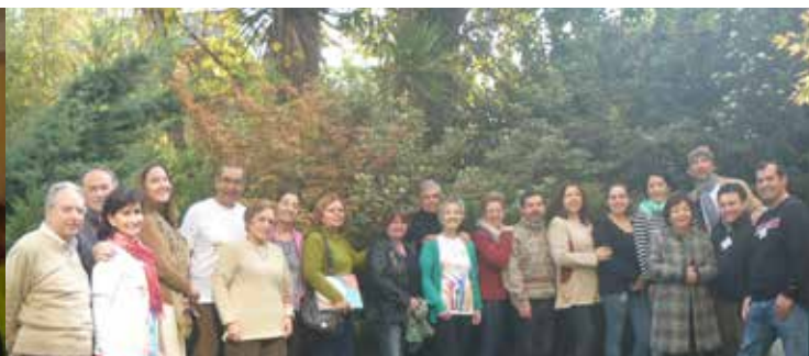
Asistentes a la Reunión de Pacientes del mes de mayo