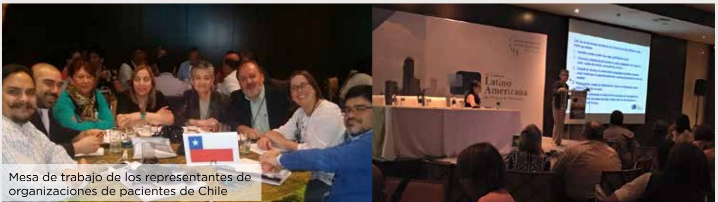
Mesa de trabajo de los representantes de organizaciones de pacientes de Chile

Desde nuestros países, reflexionando como estos temas afectan las políticas públicas de salud, y desde el punto de vista de nuestras condiciones terapéuticas, como afectan a los grupos de pacientes en los distintos países de la región.