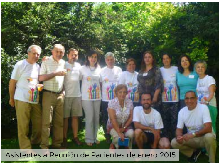
Asistentes a Reunión de Pacientes de enero 2015