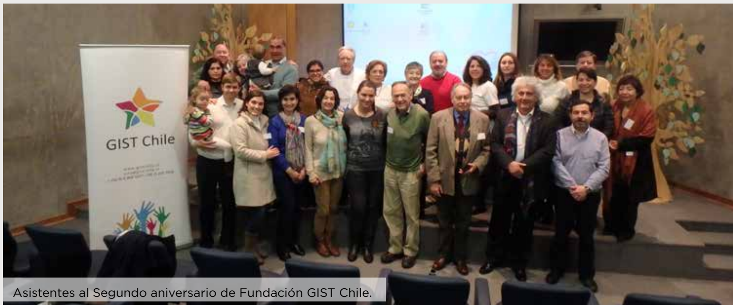
Asistentes al Segundo aniversario de Fundación GIST Chile.