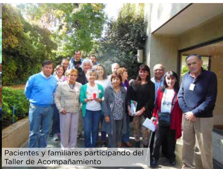
Pacientes y familiares participando del Taller de Acompañamiento