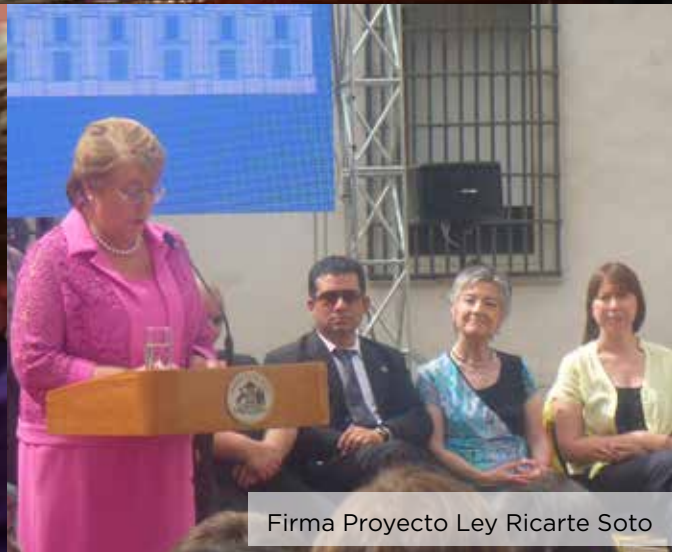
Firma Proyecto Ley Ricarte Soto