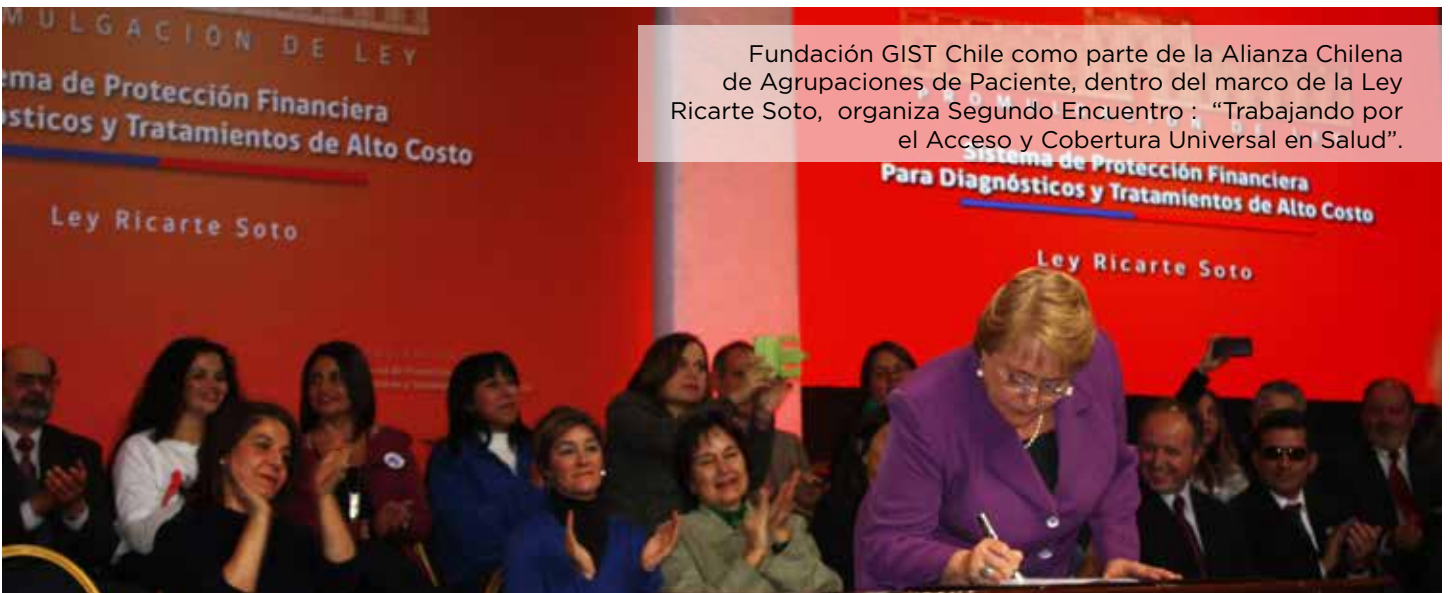
Fundación GIST Chile como parte de la Alianza Chilena de Agrupaciones de Paciente, dentro del marco de la Ley Ricarte Soto, organiza Segundo Encuentro : "Trabajando por el Acceso y Cobertura Universal en Salud".