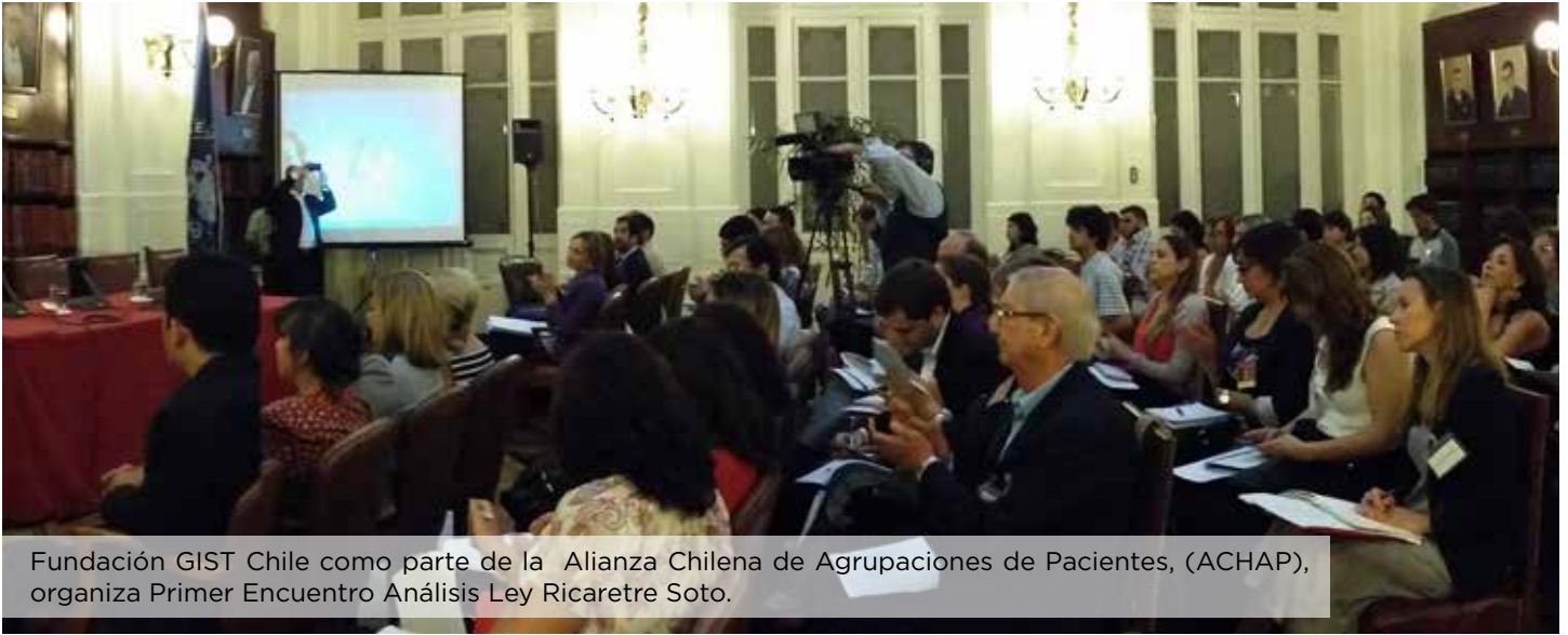
Fundación GIST Chile como parte de la Alianza Chilena de Agrupaciones de Pacientes, (ACHAP), organiza Primer Encuentro Análisis Ley Ricarte Soto.

Estuvimos presentes en la firma del proyecto de la Ley Ricarte Soto