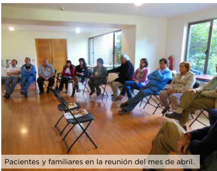
Pacientes y familiares en la reunión del mes de abril.