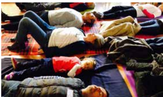
Pacientes y familiares en una sesión de relajación del Taller de acompañamiento psicológico del mes de julio