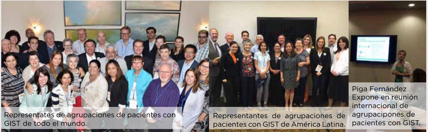
Representates de agrupaciones de pacientes con GIST de todo el mundo.

de las agrupaciones de pacientes acerca de las novedades en investigación y tratamientos para GIST. Fue también una instancia para compartir mejores prácticas y aprender de ellas.